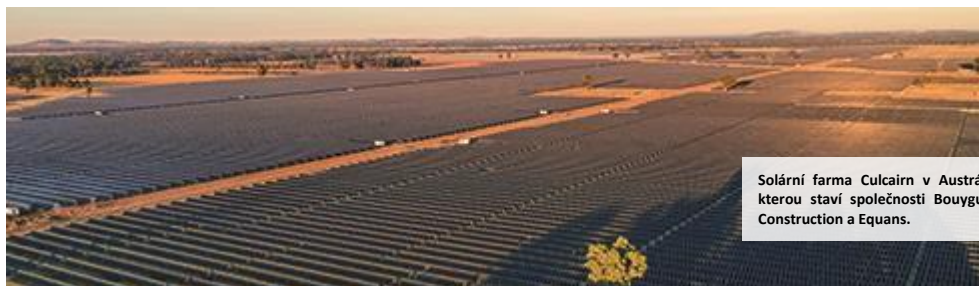
Solární farma Culcairn v Austrálii, kterou staví společnosti Bouygues Construction a Equans.